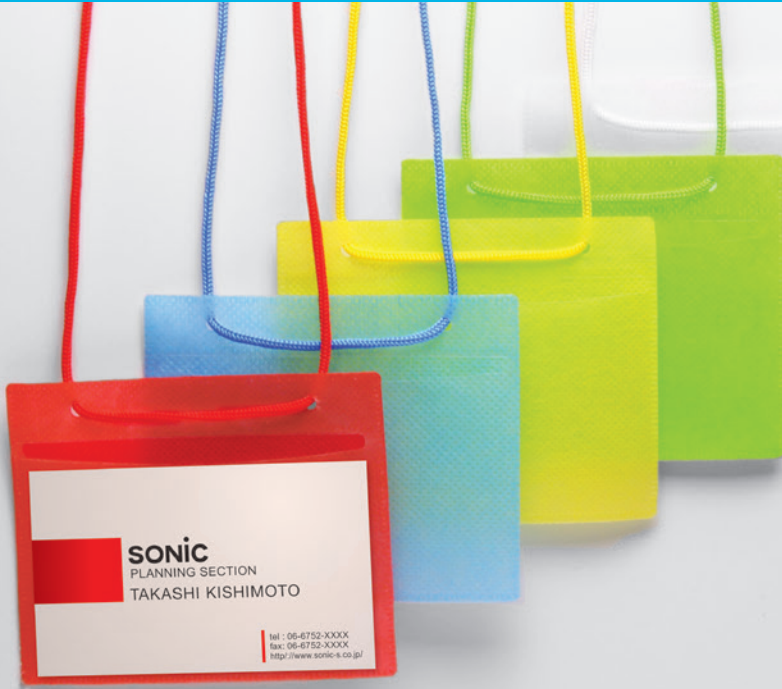
▲ カラーイベント名札 名刺サイズ