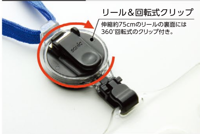
リール&回転式クリップ 伸縮約75cmのリールの裏面には360°回転式のクリップ付き。