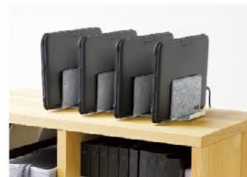
棚上などに簡易的な充電スポットをつくることができます