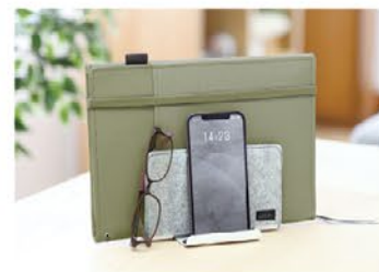
デスク周りの小物収納に