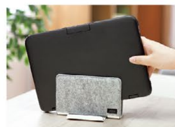
サッと片付けて、気分も切り替え